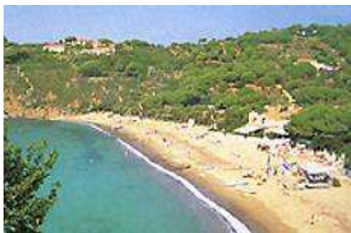
... le tante spiagge