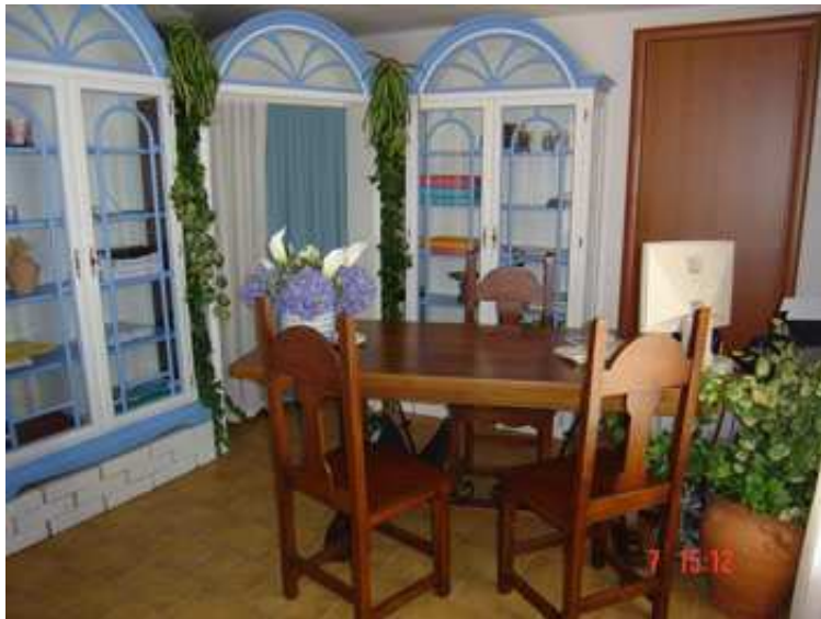
... la Reception