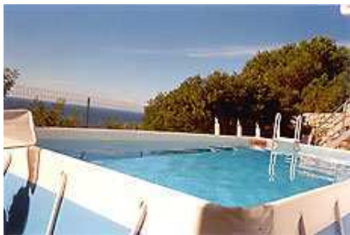
...e la piscina per bambini