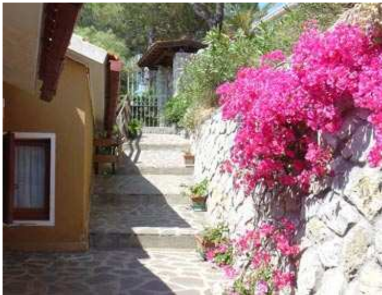
L'Ingresso pedonale e...